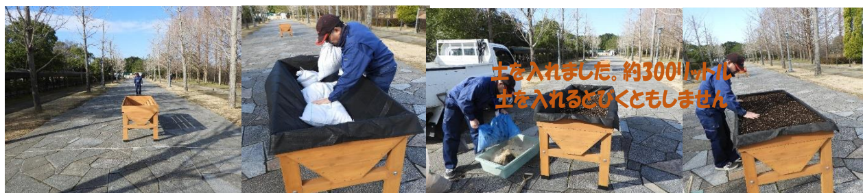
土を入れました。約300リットル土を入れるとひくともしません