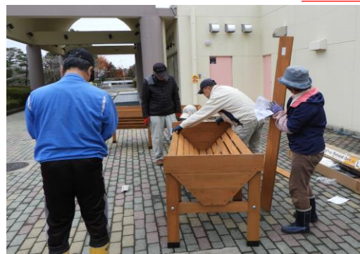
公園ボランティアの方々に組み立ててもらいました