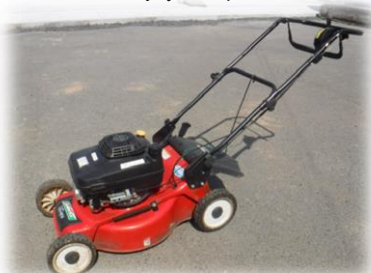
④自走式芝刈機 ロータリーモア